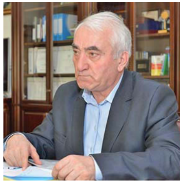
рублей, в 2019-м – 25,2 млн рублей. Темпы роста составили 327 процентов. В 2020-м ожидается получение порядка 11 млн рублей.

- Администрация проводит планомерную работу по распоряжению земельными участками, государственная собственность на которые не разграничена, а также по участкам, находящимся в собственности городского поселения. За период с 2017-го по 2020 год обеспечены значительные поступления доходов в бюджет. По всем показателям (доходы в виде арендной платы, средства от продажи прав на заключение договоров, доходы от продажи земельных участков и т.д.) отмечается значительный рост. Так, в 2017 году всего таких доходов было получено 7,7 млн рублей, в 2018-м – 12,5 млн